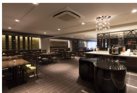
『杜のバツハ』をイメージしたレストラン