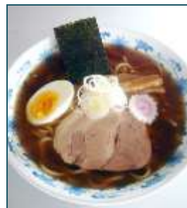
「中華そば」 (9月～11月提供予定)

当社は昨年、東京神田の名店カレーや銀座煉瓦亭の洋食メニューを提供するイベントを開催、好評をいただき、今回、初の有名ラーメン店とのコラボレーションを行うこととなりました。今後もさまざまなイベントメニューにより、お客様に楽しんでいただける食事の提供を行ってまいります。