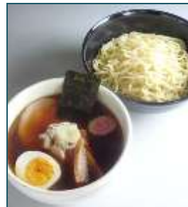
「特製もりそば」 (6月～8月提供予定)