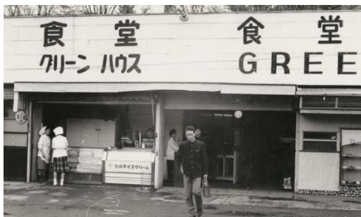
※創業当時の慶應義塾食堂