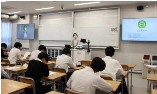
※慶應義塾高等学校にて撮影

同校の食堂は当社創業の地であり、以来75年以上もの間、食事を提供し続けてきておりますが、本講座は同校の生徒にまた別な形で「食」と「健康」に関する知識と考え方をご提供する意義深いものとなりました。本講座を通じて、次世代のリーダー育成を進める慶應義塾高等学校の教育の一助となることが期待されます。