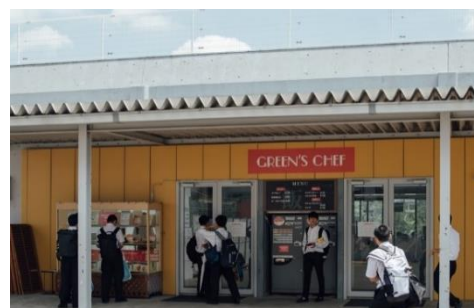
※現在の慶應義塾高等学校の食堂

1947年、慶應義塾大学の子科食堂の運営からスタートしたグリーンハウスグループは、創業以来、食を通して人々の健康を支え、お客様にご満足いただくためのビジネスを展開してまいりました。これからも「人に喜ばれること」を実践し、食を通じた健康とホスピタリティのリーディングカンパニーとして、新たな取り組みを進めてまいります。